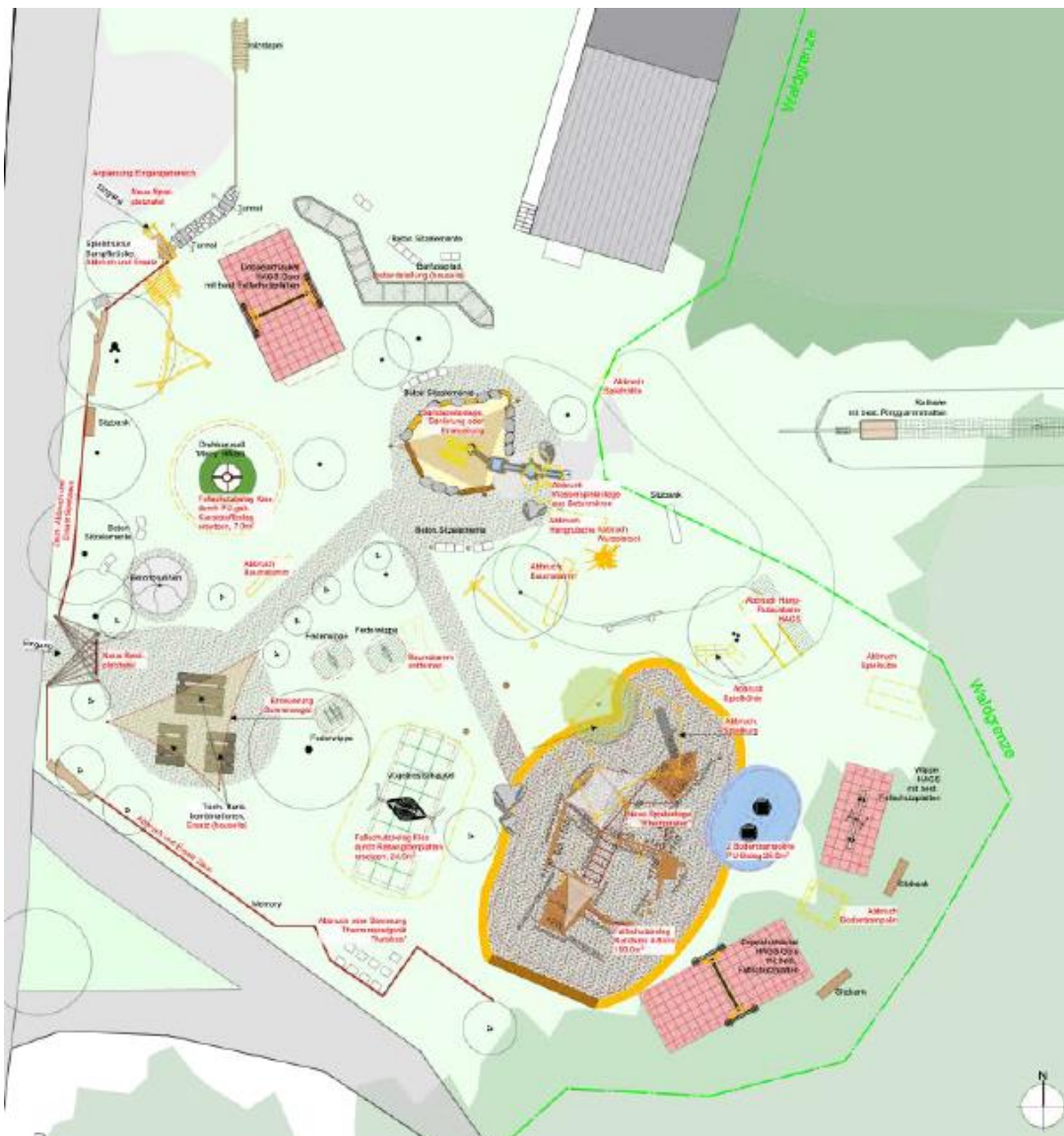
Illustraziun 2: Concept da detagl restructuraziun piazza da giug Paradieswäldli.

Avon la planisaziun ha ina pintga occurrenza da cooperaziun cun geniturs interessai giu liug. Tenor basegns san ins integrar ulteriurs affons e giuvenils dil quartier ni scolaras e scolars dalla scola vischinonta ell'ulteriura procedura da planisaziun.