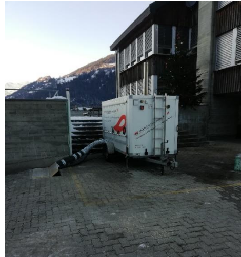
Scaldament d'urgenza installau