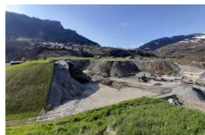
La cava sut il vitg.