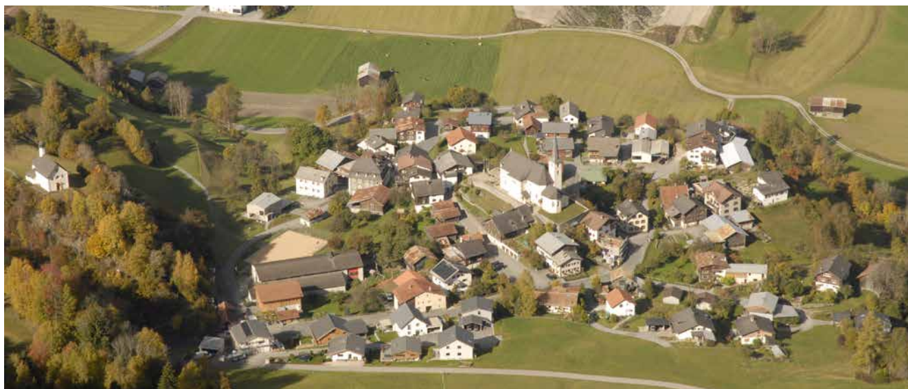
Sco ina clutscha rimna la baselgia da s. Tumasch sias pluscheinas, las casas. Seniester la baselgia da sontga Fossa.