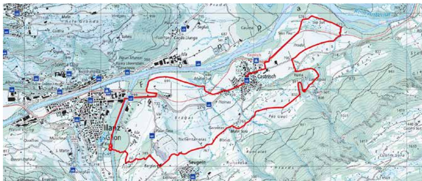
Winterwanderweg zwischen Castrisch – Ilanz – Sevgein.