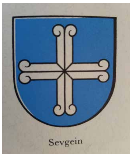
Uoppen da Sevgein.