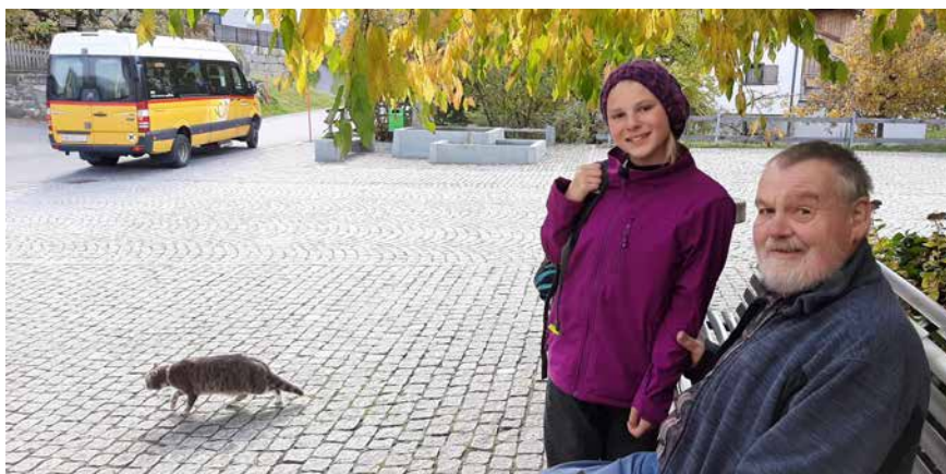
Tat Roman e biadia sin Piaz.