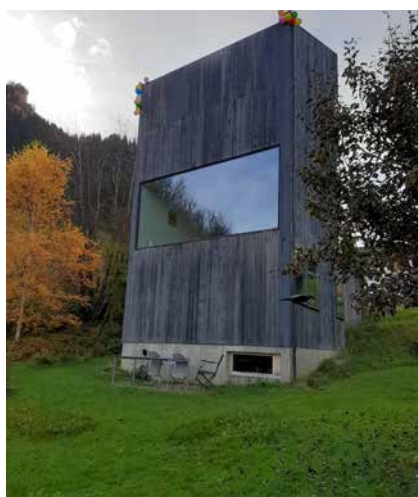
La casa pli speciala.