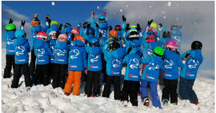
Las giaccas novas dils affons.

a cuorsas ellas disciplinas alpin, snowboard e nordic.