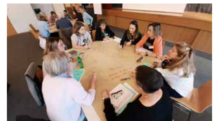
Ina dallas measas rodundas.

allen Fraktionen gesammelt. Insgesamt 126 Vereinsvorstände und kulturell tätige Einzelpersonen erhielten einen deutschen sowie romanischen Fragebogen. 78% der Angeschriebenen nutzten die Gelegenheit und gaben Auskunft über ihre heutige Tätigkeit und ihre Zukunftsperspektiven. Viele machten auch Anregungen oder stellten Fragen. Zahlreiche Wünsche und Anliegen wurden sodann anlässlich der «Fueina da cultura – Kulturschmiede» von den rund 50 Teilnehmerinnen und Teilnehmern diskutiert und deponiert. Der Anlass vom 2. Oktober 2021, an dem sich kulturell aktive