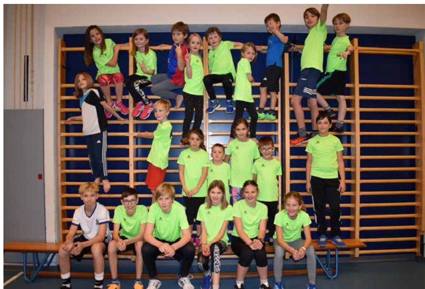
Die JO im Hallentraining.