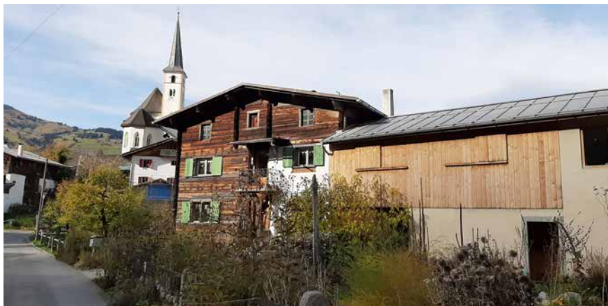
El quartier Fir.

A Sevgein constatesch'ins dabia activi- tads socialas. Chor mischedau, uniun da dunnas, uniun da giuventetgna, uni- un da tiradurs e gruppa da corns da ca- tscha rimnan regularmein la populaziun.