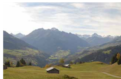
Sils cuolms da Sevgein.