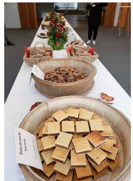
In aperitiv local ha ei dau.